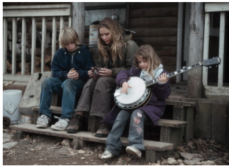
M t hình nh đ p trong &quot;Winter's Bone&quot;, nh: Roadside Attractions.

Đ i v i nh ng khán gi quen xem phim gi i trí thì Winter's Bone là m t tác ph m r t khó &quot;nh n&quot;. T i t t u ch m ch p, ít k ch tính c a phim s khi n nhi u ng i c m th y bu n ng , th m chí là không đ kiên nh n đ xem t i p khi mà phim ch a đ c phân n a. Nh ng đ i v i khán gi yêu thích dòng phim đ c l p thì đây th c s là m t b phim không th b qua. Cách k giàu hình nh, thi t k b i c nh tuy t v i, di n xu t n t ng c a dàn di n viên và câu chuy n mang nhi u thông đ i p c a Winter's Bone chính là nh ng đ i m khi n phim ghi đ c đ u n t i các gi i th ng đ i n nh l n, trong đó có Oscar.