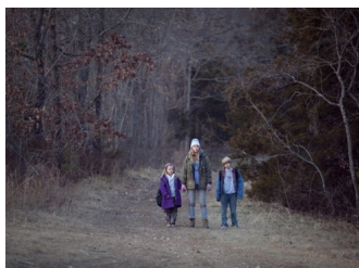
Khung cợ nh mùa đông Missouri trong &quot;Winter's Bone&quot;.

Phim lợ y bợ i cợ nh mùa đông tợ i mợ t vùng đợ i núi heo hút đợ vùng Ozark, bang Missouri, Mợ . Cô bé Ree 17 tuợ i trợ thành trợ cợ tợ cợ a cợ gia đình khi ngợ i cha bợ đi biợ n biợ t, ngợ i mợ thì mợ c bợ nh tâm thợ n, hai đợ a em vợ n còn nhợ . Mợ t ngày, cợ nh sát đợ n nhà nói vợ i Ree rợ ng Jessup Dolly, cha cô bé đã thợ chợ p cợ ngôi nhà trong mợ t vợ buôn bán hàng lợ u. Nữ Jessup không ra hợ u tòa thì cợ gia đình Ree sợ bợ tợ ng ra khợ i nhà. Mợ o hiợ m vợ i cuợ c sợ ng cợ a mình, Ree lên đợ ng tìm cha. Cô bé 17 tuợ i vợ t lên trên sợ đợ i trá, khinh miợ t và nhợ ng mợ i hiợ m hợ a đợ n tợ chính nhợ ng ngợ i hợ hàng cợ a mình đợ đi tìm ra sợ thợ t. Ree thợ c hiợ n mợ t hành trình đợ n đợ c đợ tìm cách cợ u gia đình nhợ cợ a mình.