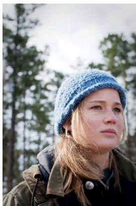
Jennifer Lawrence thủ vai Ree.

Chỉ mới 17, đáng lẽ Ree đang phải đi học ở trường, trang điểm bóng bẩy, ngó nghiêng nhìn những anh chàng trai nhà giàu như bao cô gái tuổi teen khác trong những bộ phim teen của Mỹ. Nhưng không, Ree ngày ngày bơ vơ, sẵn sàng, nấu ăn, chăm sóc cho hai đứa em nhỏ và bà mẹ già mệt mỏi tâm thần. Những buổi đi, không có bất kỳ tung tích nào. Bao nhiêu gánh nặng đè chèn ép xuống đôi vai của cô bé 17 tuổi. Mục tiêu của cô là giúp đỡ gia đình sống yên ổn, chăm lo cho gia đình mình. Hơn thế nữa, để cứu gia đình thoát khỏi cảnh vô gia cư, Ree một mình đi tìm kiếm nhà trọ ở những hàng phố hẻo lánh tung tích của bố. Tuy nhiên, cô bị bắt gặp, lăng mạ, thậm chí là đánh đập tàn nhẫn chỉ vì tất cả bọn họ đều có dính dáng tới ma túy và sự liên lạc.