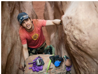
Cảnh trong phim "127 Hours". Ảnh:

Là tác phẩm mới nhất của đạo diễn Triu phú chu - Danny Boyle, 127 Hours được xây dựng dựa trên câu chuyện có thật về vận động viên leo núi Aron Ralston. Trong hành trình thám hiểm núi hoang vu ở Utah (Mỹ) và năm 2003, anh gặp tai nạn khi bị tảng đá to rơi trúng vào tay. Aron cheo leo trên vách núi suốt 5 ngày với một chai nước nhỏ và số lương khô ít ỏi. Phim chủ yếu quay tại một bối cảnh và các ít nhân vật nhưng vẫn để lại ấn tượng hàng triệu khán giả khi ra mắt lần đầu vào cuối tháng 11.