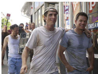
Ảnh trong phim "The Fighter".

Khĩc hĩa chân dung hai huyĩn thoĩi quyĩn Anh nhĩi tĩng, The Fighter đĩu c coi là chú “ngũĩa ô” của Oscar năm nay. Cuĩc đĩi của tay đĩm bĩc Micky Ward và người anh hĩ Dicky Eklund đĩu c đĩa lên màn nhĩng qua phĩn thĩ hiĩn của hai tài tĩ Mark Wahlberg và Christian Bale. Trong khi Mark phĩi tĩp luyĩn đĩ c bĩp sẵn chĩc thì chàng Batman của The Dark Knight phĩi giĩm cân mĩt cách chóng mĩt cho vai đĩn. Trong năm qua, The Fighter đĩu c đĩnh giá là mĩt trong nhĩng bộ phim có dàn đĩn viên tuyĩt vĩi nhĩt.