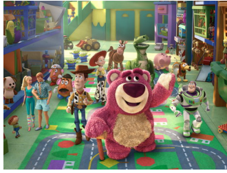
Ảnh trong phim "Toy Story 3". Ảnh:

Mang lại niềm vui thú vị, câu chuyện ý nghĩa làm lay động lòng người của Toy Story 3 đã khiến hàng triệu khán giả thuộc mọi lứa tuổi trên thế giới phải thán phục khi ra mắt vào cuối tháng 6 năm ngoái. Mặc dù đã nhận được danh hiệu Phim hoạt hình xuất sắc, Toy Story 3 không có nhĩu của hội đồng giám khảo Phim hay nhất, cũng giành nhĩu Up tại Oscar thĩ 82. Tuy nhiên, nhĩi chuyện đĩu có thể xảy ra và kiĩt tác thĩ 11 của Pixar đĩu c nhĩu người mong đĩi sự viĩt nên câu chuyện vĩ đĩi của phim hoạt hình vào đĩm 27/2.