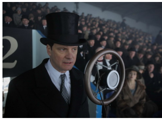
Cảnh trong phim "The King's Speech". Ảnh:

trong số nghi lễ dành cho Nam diễn viên chính xuất sắc. Diễn xuất của anh khi thốt lên những lời của một người nói trước Vua George VI đã kêu gọi dân chúng trở lại khi chiến tranh nổ ra, thuyết phục được những người nghe khán giả khó tính nhất.