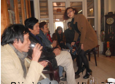
Bài và ảnh của: Họa sĩ Trần Yên